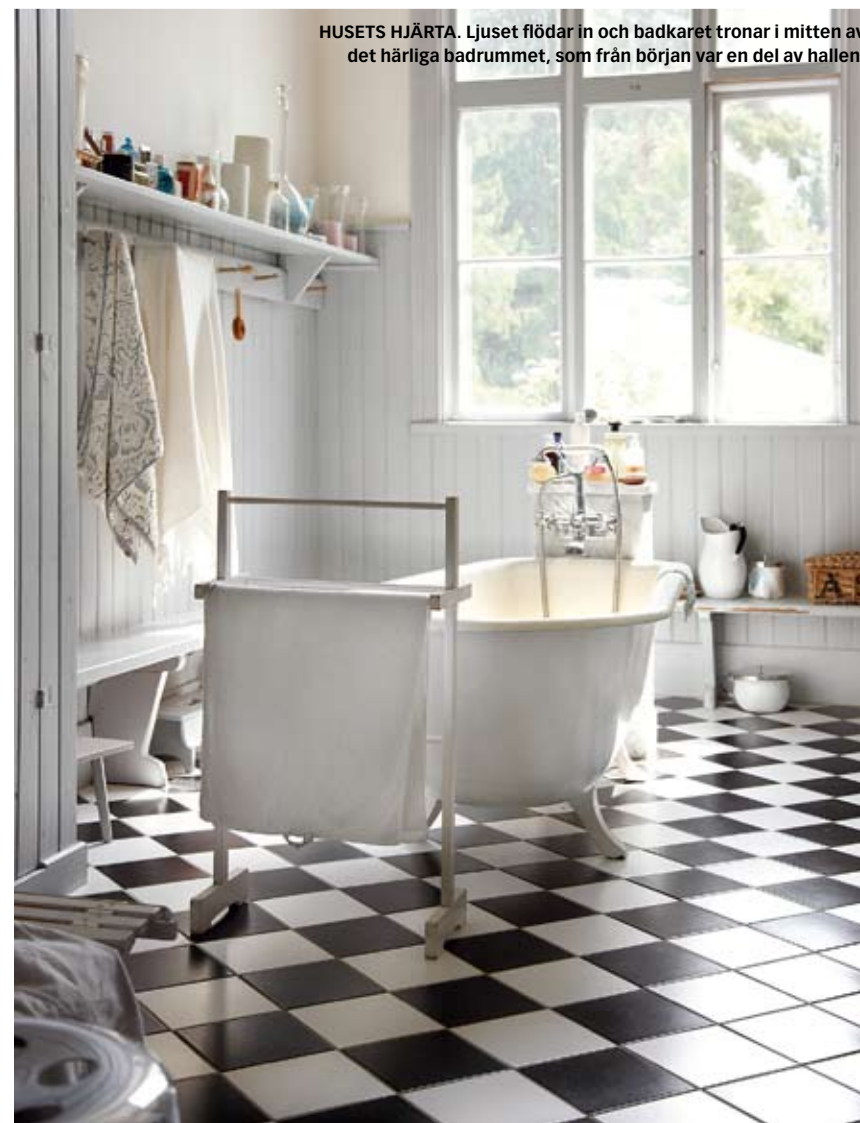
HUSETS HJÄRTA. Ljuset flödar in och badkaret tronar i mitten av det härliga badrummet, som från början var en del av hallen.