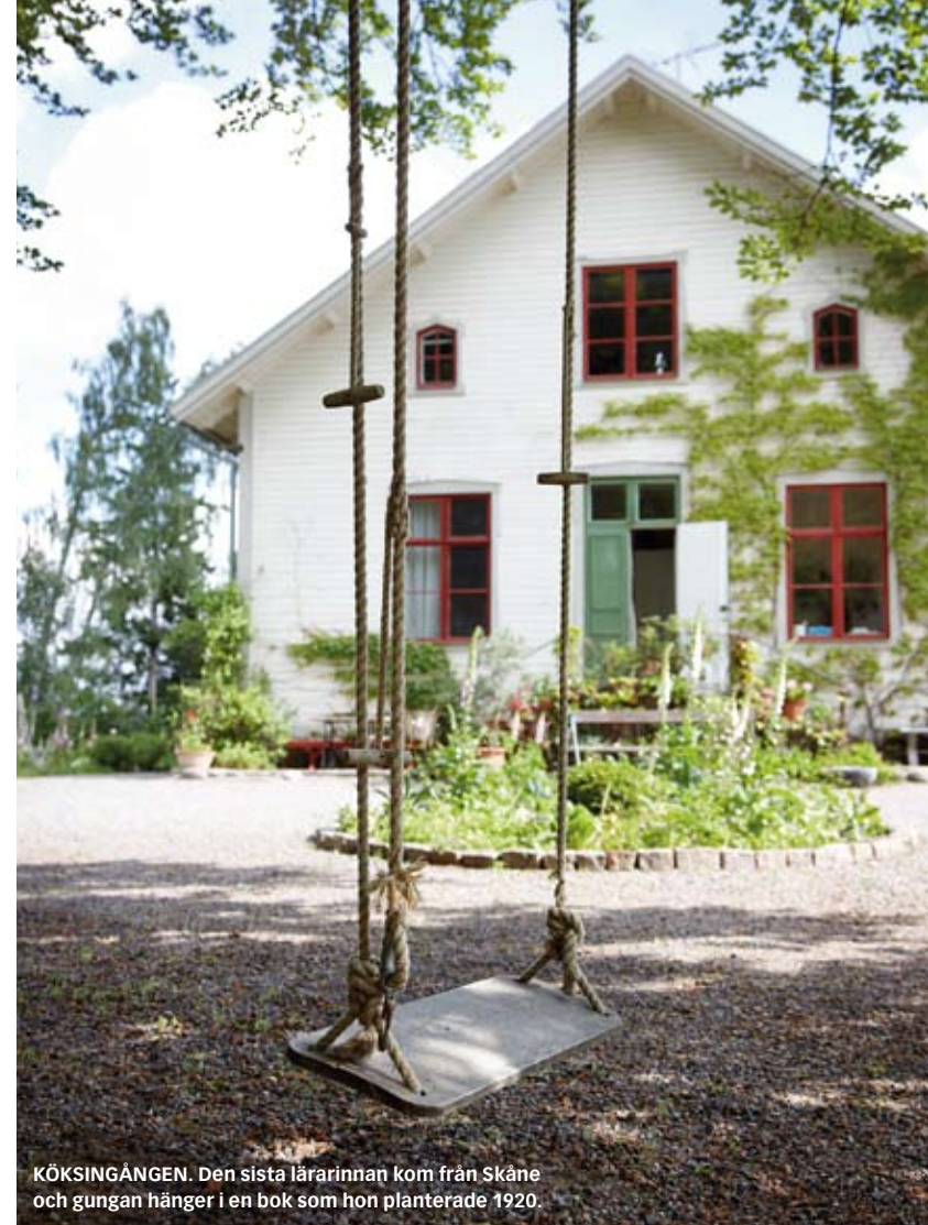
KÖKSINGÅNGEN. Den sista lärarinnan kom från Skåne och gungan hänger i en bok som hon planterade 1920.