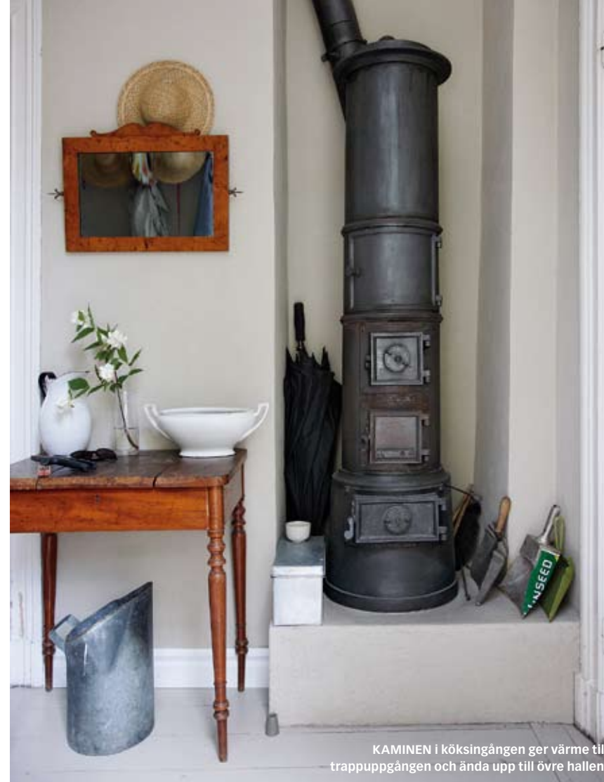
KAMINEN i köksingången ger värme till trappuppgången och ända upp till övre hallen.