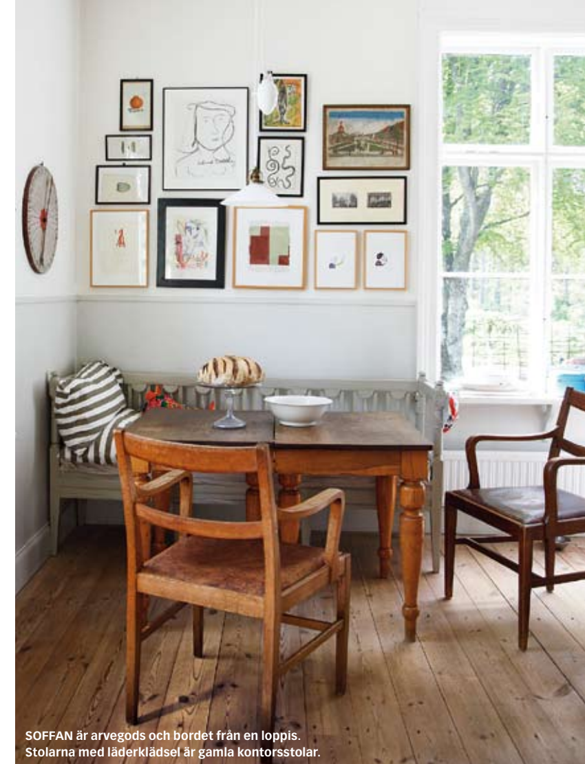
SOFFAN är arvegods och bordet från en loppis. Stolarna med läderklädsel är gamla kontorsstolar.